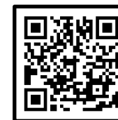
インテリアドリーム特設サイト

【URL】 https://interiordream.hattori-kagu-center.co.jp/voicedrama/