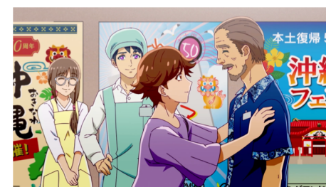
「幸せの先にあるもの」 2022年 https://youtu.be/ht-Cu25nFc0