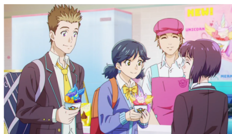
「大切なもの」 2021年 https://youtu.be/qCDTVBvTHc