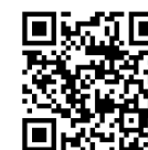
バイクストーリー