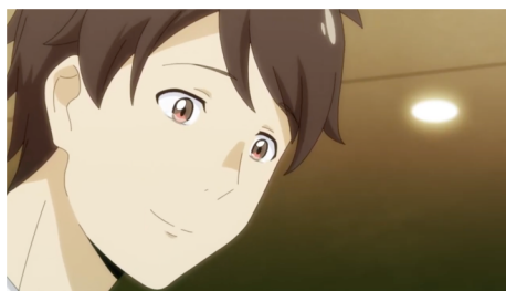
「小さな幸せ」 2020年 https://youtu.be/X8PEcEPRy24

セブン&アイ ホールディングスのショッピングモール、デベロッパーのセブン&アイクリエイイトリンクは、2020年よりオリジナルアニメーションを制作。2023年で4年目（4作目）となります。内容は、ショッピングモールを舞台に、さまざまな世代の家族や友人たちの心温まる物語。ストーリーの中に自然に企業のブランディングとなるメッセージを盛り込んでいます。また、同時に全国22店舗でアニメに出演する声優を募集する“声優オーディション”もショッピングモール内で実施。昨今の声優オーディションブームと相まって集客の増大に貢献しています。